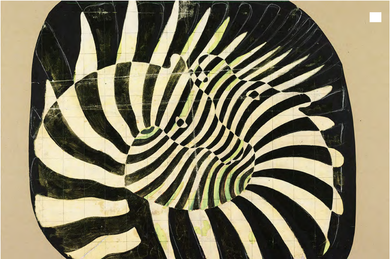
Cebras, obra de Victor Vasarely de 1939, en el Thyssen-Bornemisza hasta septiembre.

Abrir los ojos. Entornarlos. Acercarte un poco más. Retroceder para tomar distancia. Y descubrir que, en cada paso, la obra enfrente de ti cambia. Se mueve. Te absorbe. Te embauca. Detrás de todo eso está Victor Vasarely (1908-1997) y su peculiar forma de entender el arte, de hacerlo matemático, geométrico, espacial, óptico. Con él llegó la revolución y ahora ésta desembarca en España. El Museo Thyssen-Bornemisza acoge del 7 de junio al 9 de septiembre una exposición que pretende acercar al público español la genialidad de este artista húngaro. Nada más y nada menos que 88 obras de arte y dos películas permitirán conocer mejor al que fuera el padre del Op Art, arte óptico , a mediados del siglo pasado.