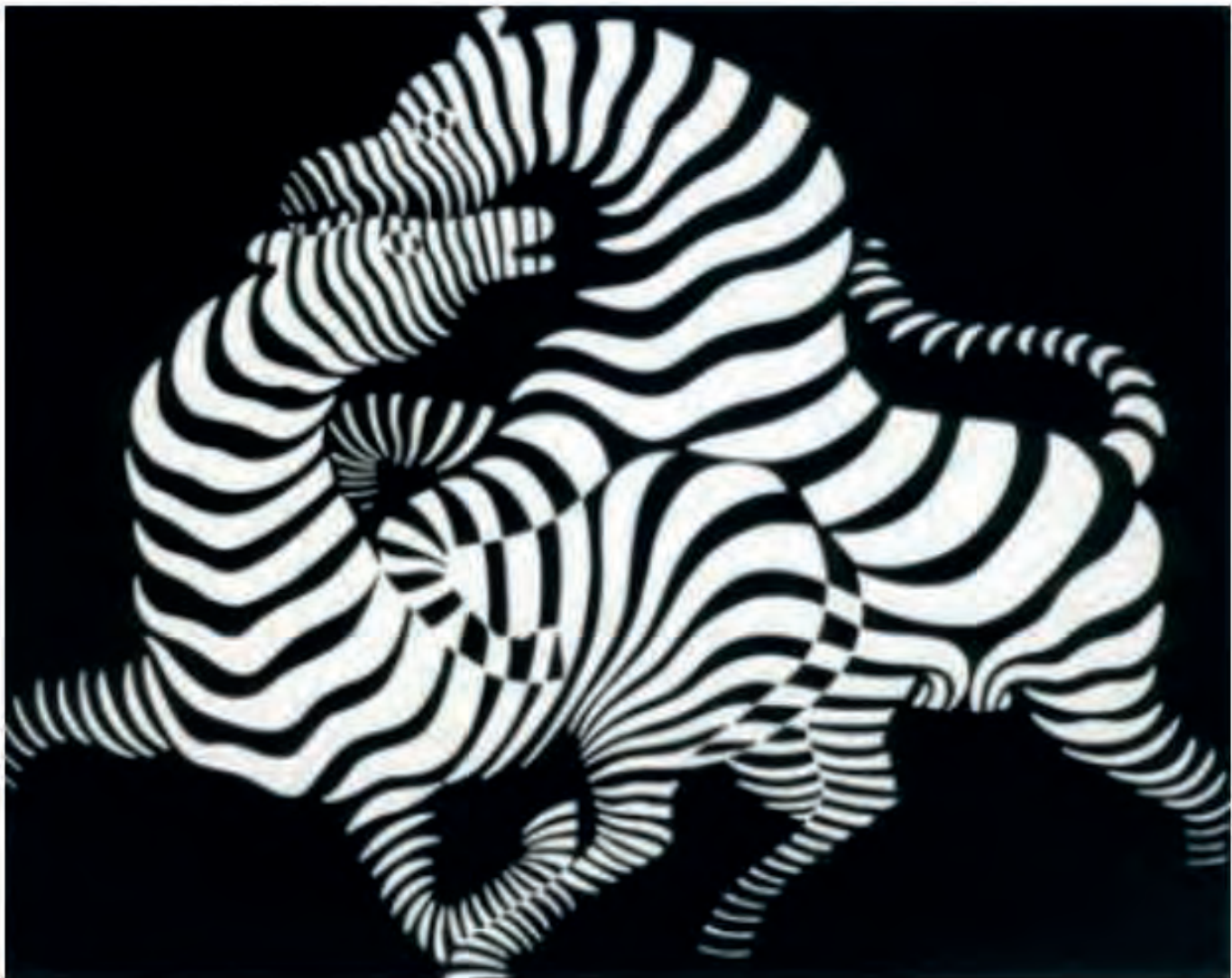
'Zebra', una de las obras fundadoras del op-art (Especial)

Se trasladó a París al principio de los años treinta y allí trabajó como grafista. En esta ciudad desarrolló su primer trabajo mayor, Zebra , que se considera hoy en día la primera obra del op-art. Vasarely desarrolló un modelo propio de arte abstracto geométrico, con efectos ópticos de movimiento, formas, perspectivas e imágenes inestables. Utilizó diversos materiales pero usando un número mínimo de formas y de colores. Tenía consideración por la pintura mesurada, reposada, racional y serena.