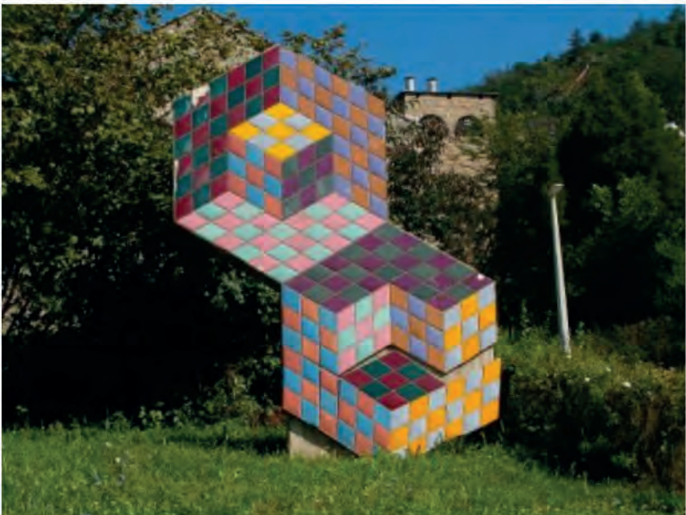
La paradoja visual del volumen (Especial)

Te recomendamos: Las caritas sonrientes llegan al Museo Regional